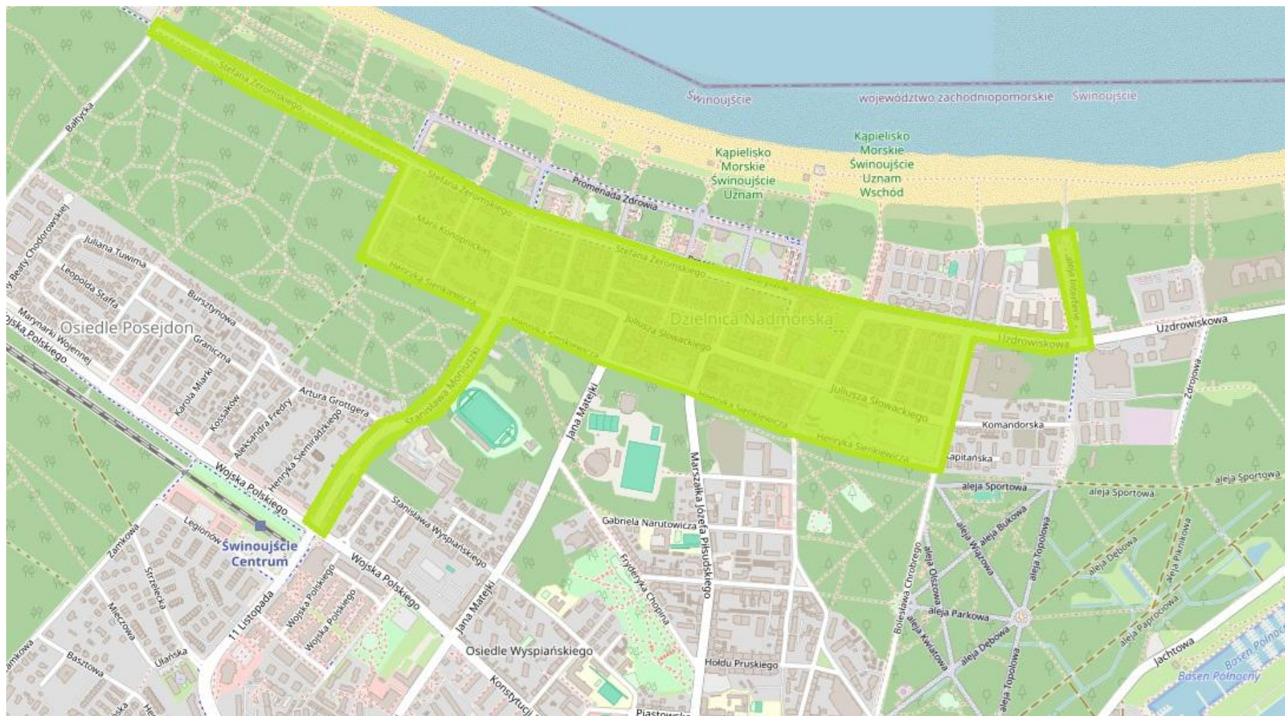
Śródmiejska Strefa Płatnego Parkowania